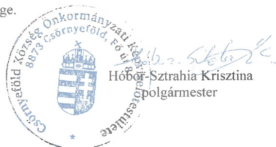
Hóbor-Sztrahia Krisztina polgármester