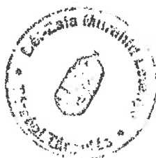
Molnár Enikő belső ellenőr