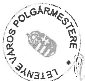
Farkas Szilárd polgármester