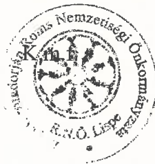
Orsós Ibolya jegyzőkönyv hitelesítő