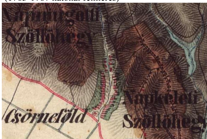
(1806-1869 katonai felmérés)