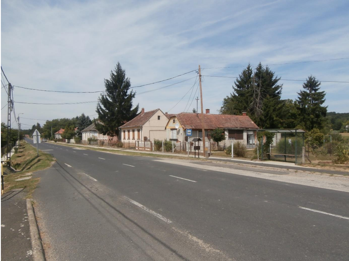
Dózsa Gy. utca

A településen van néhány régi épület, melyek tömege, formája védelemre érdemes. A település halmazos beépítést mutat, a domborzati viszonyokhoz rendkívül jó alkalmazkodott. A változatos telekosztású utca, domborzatra érzékeny telepítéssel. Az épületek formai kialakítása az adott kor stílusjegyeit viselik magukon, jellemzően sátor vagy nyeregtetős kialakításúak. Íves vonalvezetésű, szabályos, állandó szélességű utcaszakasz, ahol az épületek a nyugati oldalhatárra települtek, minimális előkertet hagyva a közterület felé. A domborzati sokszínűséghez alkalmazkodtak a telepítések.