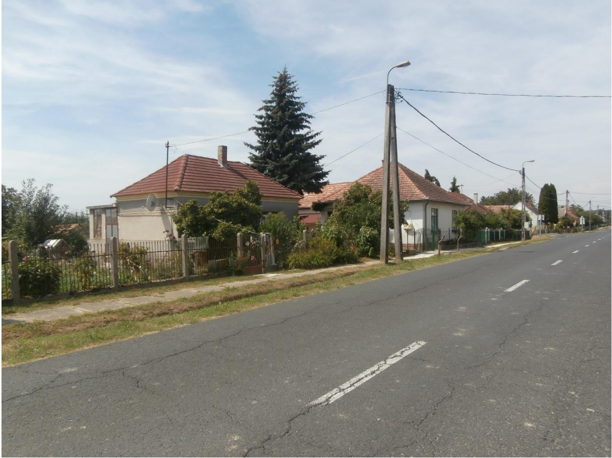
(Dózsa Gy. utca)