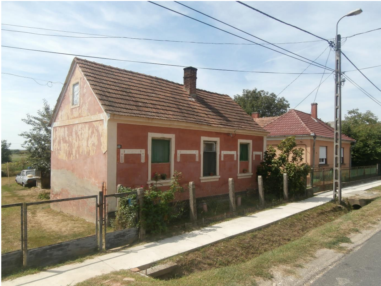
Dózsa Gy. utca

A település szerkezetének kialakulásában a természetföldrajzi adottságok, a községet körülölelő szőlőhegyek és az átszelő közlekedési útvonalak játszottak alapvető szerepet.