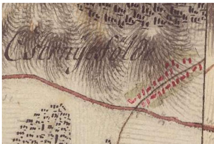
(1763-1787 katonai felmérés)

Csörnyeföld településtörténete az alábbi három katonai térképen jól követhető, a település folyamatos növekedése, a településrészek kialakulása kísérhető figyelemmel.