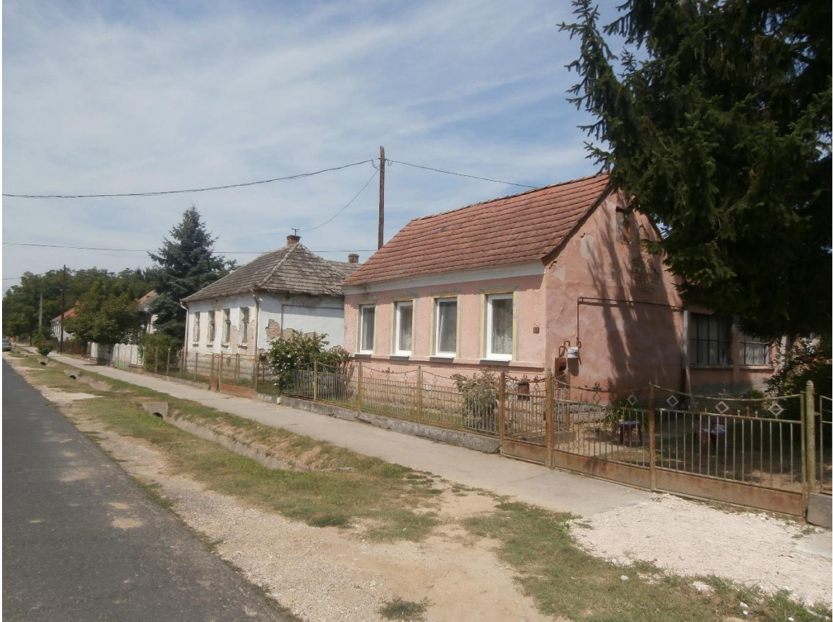
Dózsa Gy. utca

A különböző korok épületei, eltérő előkertet tartva épültek, emiatt az utca homlokzati látványa mozgalmas, nem ad egységes vonalvezetést a homlokzati sorfal. Egységes épületkarakterről nem beszélhetünk, a tömegek és tetők formálása nagyon változatos. A sátoztető mellett sok ponton megjelenik az utcavonallal párhuzamos tetőgerinc is.